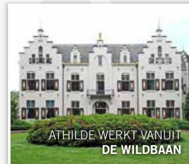
ATHILDE WERKT VANUIT DE WILDBAAN